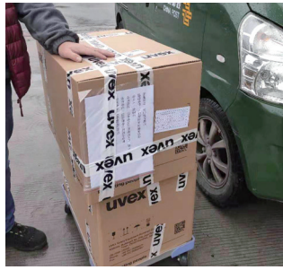
中国职业安全健康协会向河南医院捐赠物资