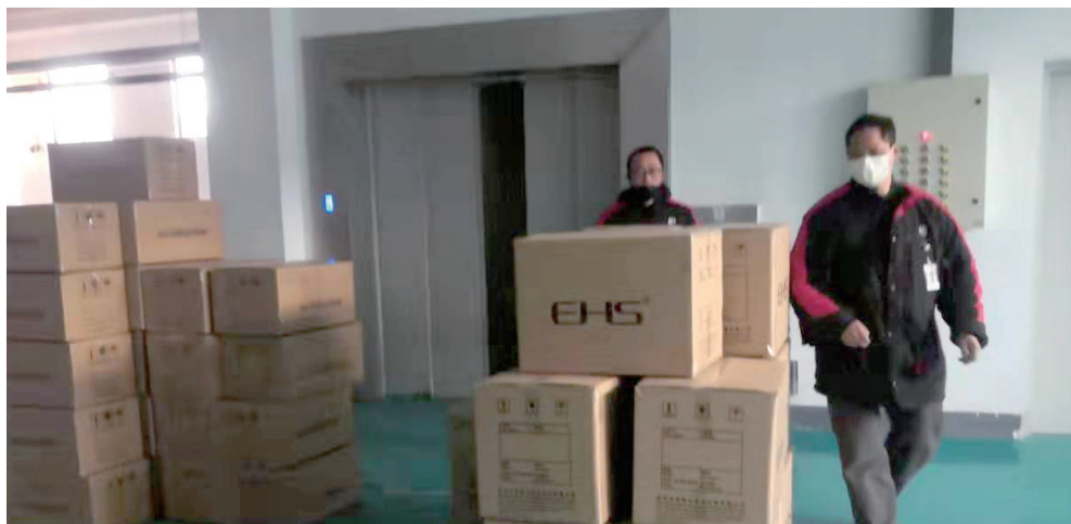
个体防护专业委员会筹集医疗物资赠予13家医院助力抗击疫情

在此，向所有积极捐赠的爱心人士、向奋力保障物资生产和供应的同胞们表示最诚挚的谢意。