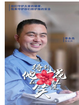
关键时刻,永霏公司党支部的战斗堡垒作用

成立于2016年11月的永霏公司党支部,目前有党员13人,入党积极分子10人,疫情期间积极响应各级党委特别是高新区党工委和创新创业中心党委号召,冲锋在前,发挥了积极作用。正如2020年1月27日习近平总书记作重要指示时所强调,基层党组织和广大党员要发挥战斗堡垒作用和先锋模范作用。