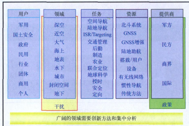
图1 新时空服务体系要素概览图

国家新时空技术体系应该考虑的要素包括产品和服务的提供者、产品和服务的用户群、提供和应用的物理环境、领域和能力的各种各样的不同应用,以及新时空信息产生、采集、存储、传输和分发的技术资源和手段(如图1所示)。应该指出,现代信息社会中的根本流程要素是:泛在感知、普适传输、物联互通、智能服务,这是一切信息系统的科学研究、生产制造、应用服务的出发点和落脚点。