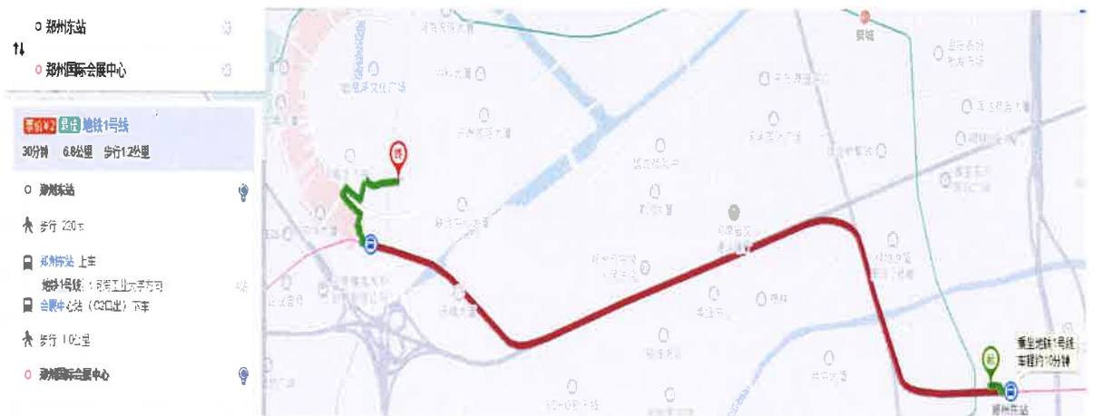
图 2 郑州东站至郑州国际会展中心交通示意图