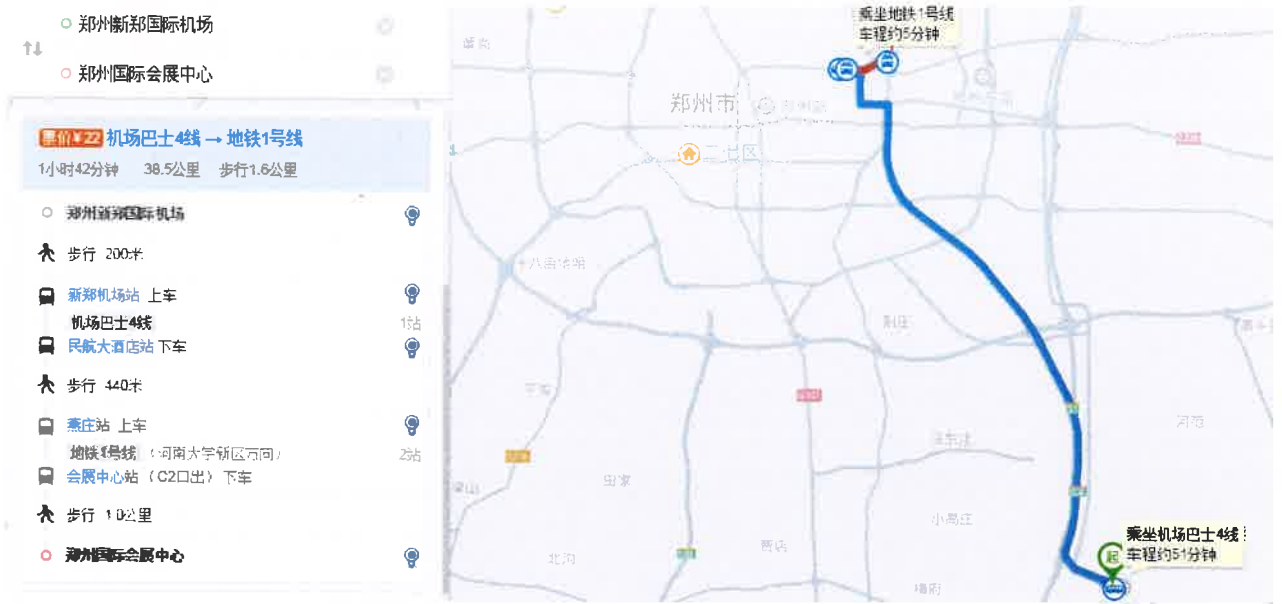
图 1 新郑国际机场乘坐机场巴士至郑州国际会展中心交通示意图